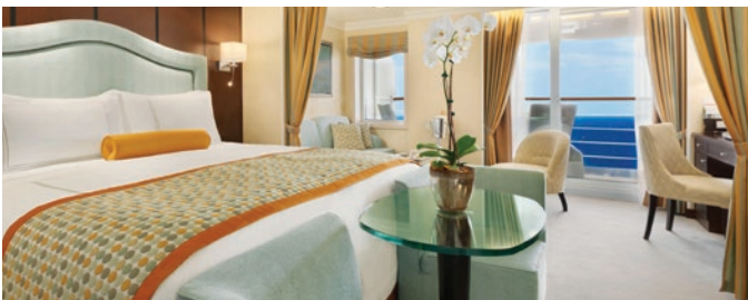
PH1 | PH2 | PH3 | Suite Penthouse

Quand il est question de confort et de beauté, les élégantes suites Penthouse rivalisent avec n'importe quel hôtel cinq étoiles de classe mondiale. Une conception ingénieuse permet d'optimiser leur surface de 39 mètres carrés. Ces suites disposent d'une table pour vos repas, d'un coin salon séparé, d'une grande baignoire/douche et d'une douche séparée, d'un dressing et d'une véranda privée. Profitez d'un accès exclusif par carte au salon privé Executive Lounge et des services d'un concierge dédié.