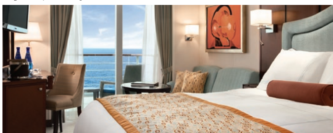
B1 | B2 | B3 | B4 | Cabine avec Véranda

Ces chambres luxueuses offrent une multitude de services, y compris un grand nombre de ceux proposés dans nos suites Penthouse. Ces cabines de 26 mètres carrés aménagées avec goût proposent une véranda privée, un coin salon feutré, un mini-bar/réfrigérateur, une salle de bain spacieuse en marbre et granit avec grande baignoire/douche et une douche séparée. Les passagers ont également accès au salon privé Concierge Lounge avec son concierge dédié, ses magazines, journaux quotidiens, boissons et collations.