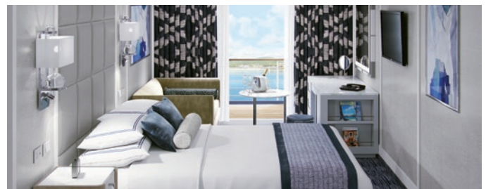
A1 | A2 | A3 | Cabine avec Véranda niveau Concierge

Notre gamme de Suites Penthouse de 29 mètres carrés offre un décor splendide et serein composé de meubles choisis pour votre confort, dans des tons marins et ensoleillés. La spacieuse salle de séjour vous permet de dîner en privé dans votre propre suite. La cabine est également équipée d'un mini-bar/réfrigérateur et d'une coiffeuse, et la salle de bain aux lignes pures présente des finitions luxueuses en pierre et une douche.