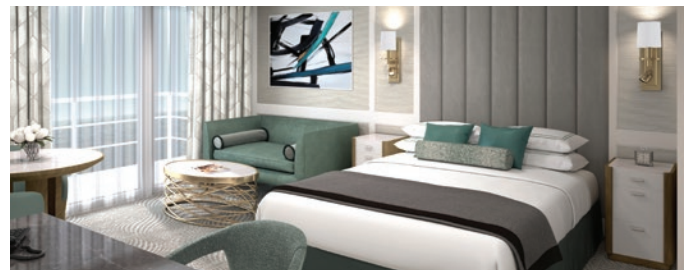
PH1 | PH2 | PH3 | Suite Penthouse

Notre gamme de Suites Penthouse de 29 mètres carrés offre un décor splendide et serein composé de meubles choisis pour votre confort, dans des tons marins et ensoleillés. La spacieuse salle de séjour vous permet de dîner en privé dans votre propre suite. La cabine est également équipée d'un mini-bar/réfrigérateur et d'une coiffeuse, et la salle de bain aux lignes pures présente des finitions luxueuses en pierre et une douche.